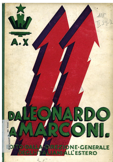
Fig. 2 - Francesco Savorgnan di Brazzà, Da Leonardo a Marconi . Roma, Poligrafico dello Stato, 1932.

Le lettere intercorse fra Savorgnan e Provenzal, conservate presso l'Archivio di Stato di Udine, non forniscono informazioni in merito ad una effettiva partecipazione dello scrittore all'impresa americana. Resta il fatto che fra gli oggetti inviati a Chicago sono molti quelli di cui Savorgnan ha rivendicato il 'primato italiano'; inoltre risultano presenti nella Raccolta documentaria tutti