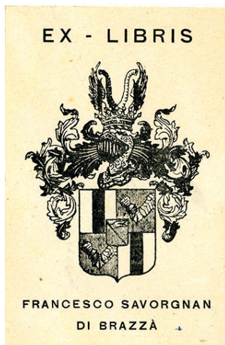
Fig. 5 - Ex libris presente sui volumi del fondo librario Savorgnan, al Museo della scienza e tecnologia di Milano.

Sulla geologia sono presenti i quattro volumi pubblicati tra il 1866 e il 1869 da Antonio Stoppani, che riprendono le lezioni del corso per ingegneri allievi del Reale Istituto Tecnico Superiore di Milano.