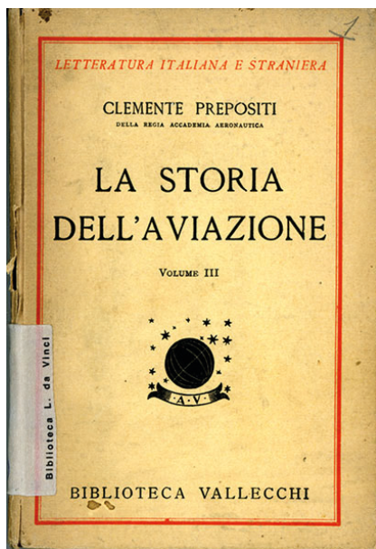
Fig. 4 - La storia dell'aviazione di Clemente Prepositi (Firenze, Vallecchi, 1931) è il primo bene ad entrare nelle collezioni del Museo della scienza e della tecnica di Milano.

La sezione aeronautica riflette la sua passione per il volo: il primo bene del nuovo museo ad essere inventariato è il volume La storia dell'aviazione di Clemente Prepositi (Bologna, Licinio Cappelli Editore, 1931) (Fig.4).